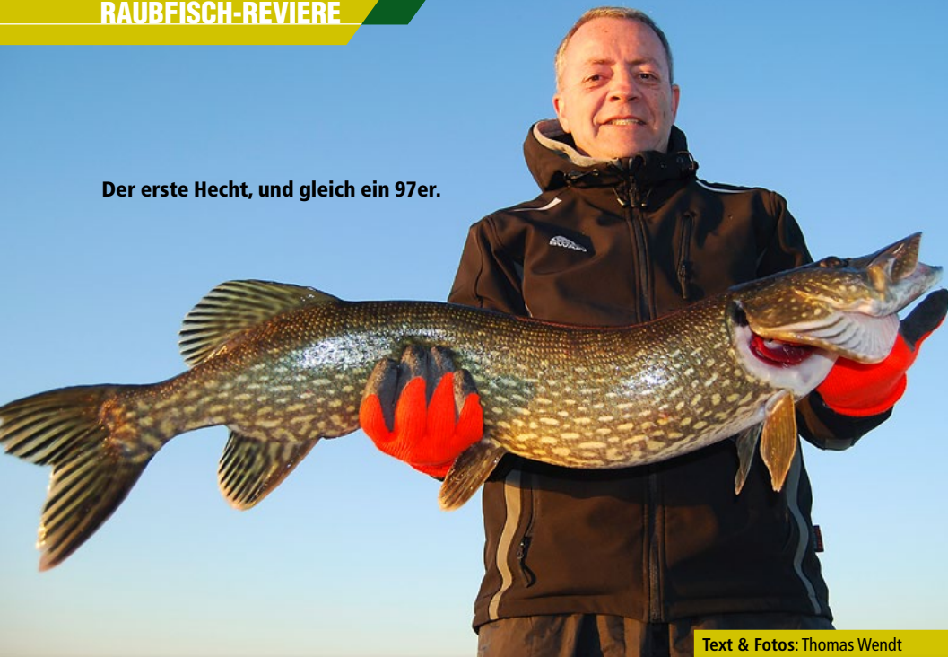
Text & Fotos: Thomas Wendt

Erholungsurlaub und ein bisschen angeln. Thomas Wendt hat mit Frau und Freunden ein ideales Ziel in Schweden gefunden.