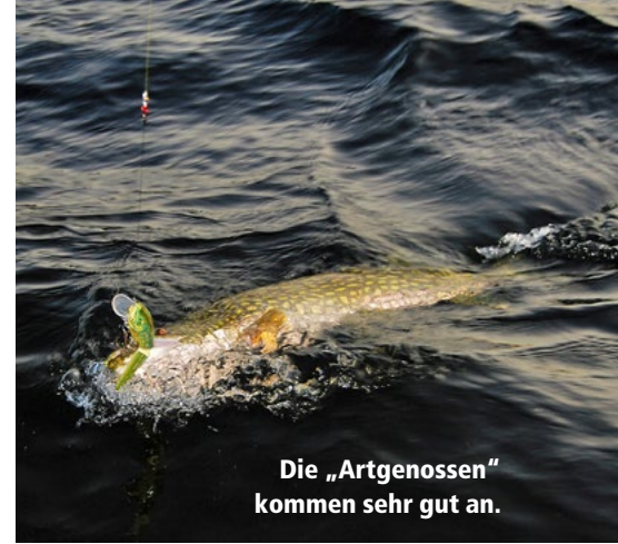
Die „Artgenossen“ kommen sehr gut an.

Der Bunn ist durch zwei Straßenüberquerungen quasi dreigeteilt. Das Wasser ist deutlich trüber als im Ören, und das Gewäs-